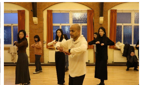
莎莎舞教学与联谊